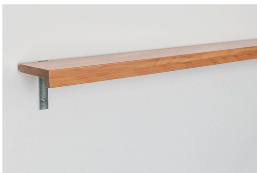
Porte-effets hêtre monobloc avec rebord frontal