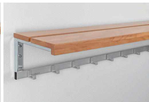
Porte-effets hêtre en deux parties avec rebord frontal Facultatif avec bande de crochet