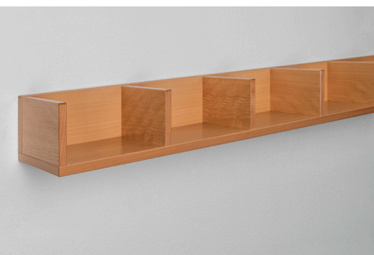
Ablage SCHAFFHAUSEN in Buche